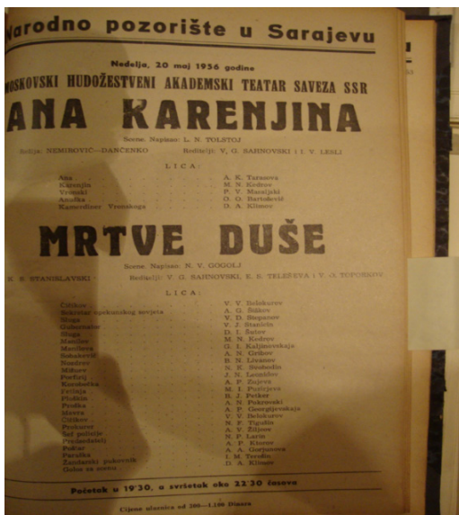
Slika 3. Ana Karenjina i Mrtve duše (1956): Plakat Slika 4. Rat i mir (1959): Plakat