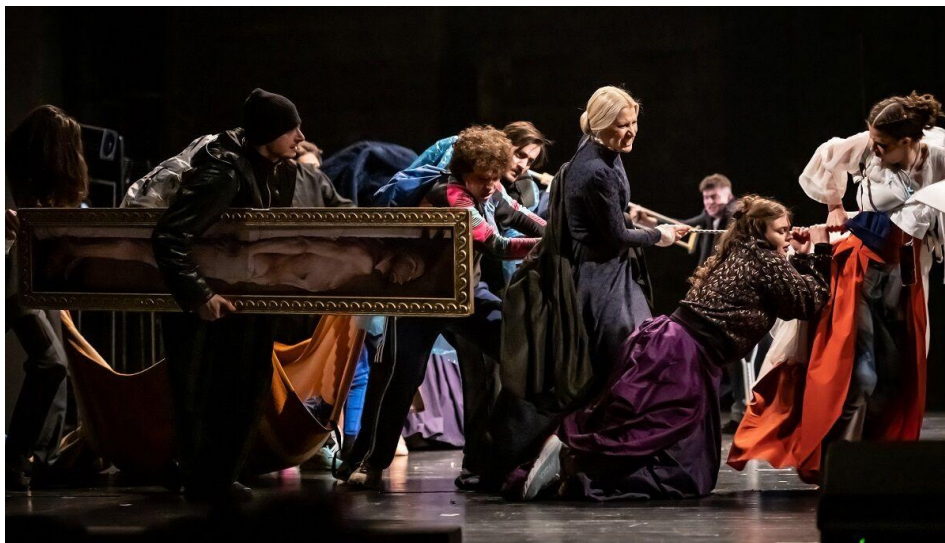
Slika 6. Idiot (2023)

Slika 6. Idiot , režija Selma Spahić, Narodno pozorište Sarajevo,